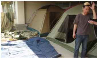
平成27年6月20日 校庭キャンプ準備

これまでに、一般的なテント設営、学校や市役所などのご協力により着衣泳体験、防災用飯盒炊飯器による炊き出し体験、防災倉庫内の見学、非常食の朝食体験、仮設トイレの組み立て体験などを実施しました。また、飯盒炊飯、カレー作り、キャンプファイヤー、肝試しなどのレクリエーションも実施しています。子どもたちに「みんなで作る、遊ぶ、考える」大切さを伝えています。