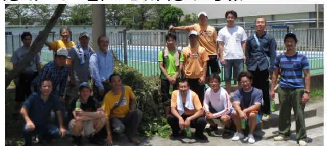
平成 27 年 6 月 20 日プール掃除