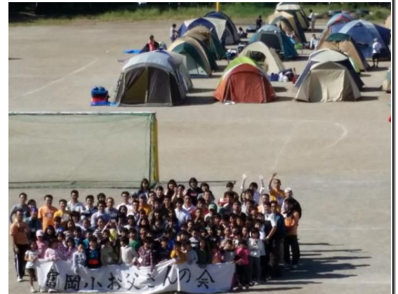
平成26年9月20・21日 校庭キャンプ

(9) 世界が広がります。お父さんの会に入っていなかったら平凡な日常だったかも。